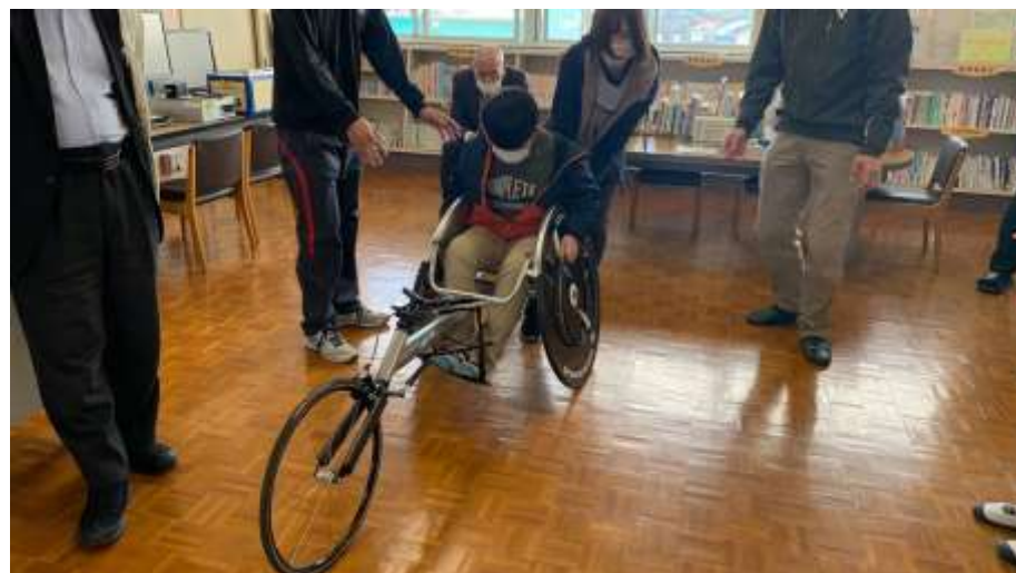
陸上競技用車いす（レーサー）体験