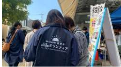
イベントでの活動

・2023 鹿児島国体・SAGA2024 国スポ応援プロジェクトの推進 両大会の開催を契機として、「する」「みる」「ささえる」の面で地域とスポーツが交流するしくみづくりを推進しました。