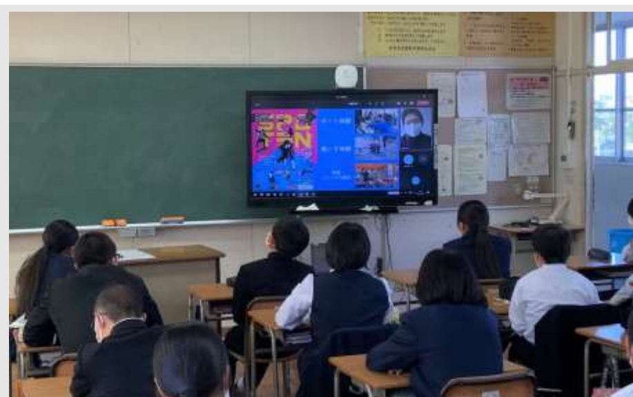
リモートによる実施