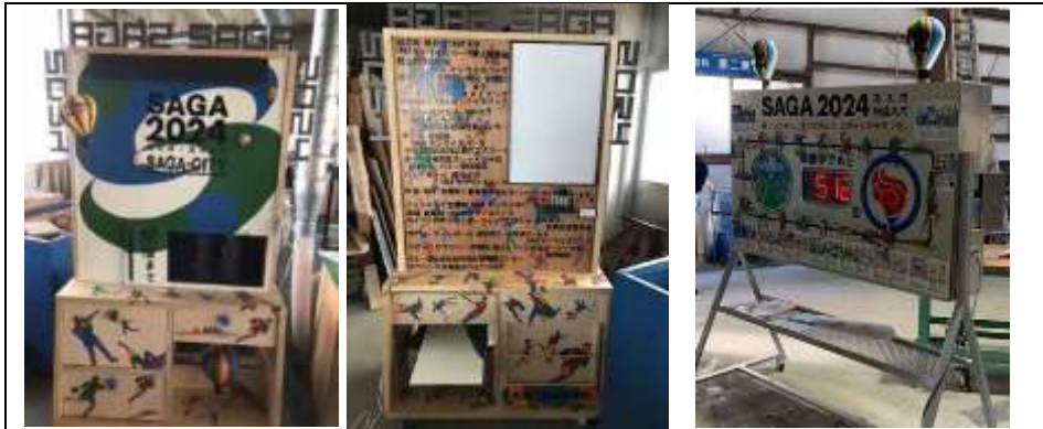
佐賀工業高校製作