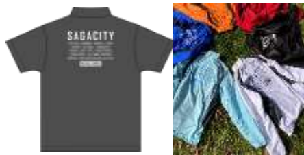
ポロシャツ、ジャケット