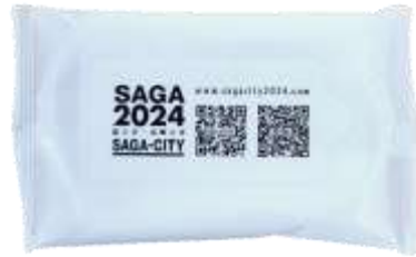
ウェットティッシュ