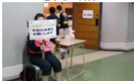
全国大会運営協力