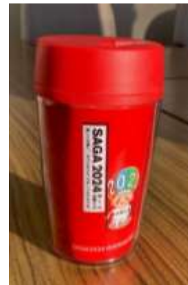
佐賀商業高校との連携タンブラー