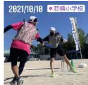
校区運動会での体験