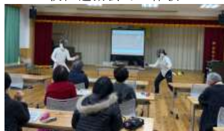
公民館主催講座での競技紹介