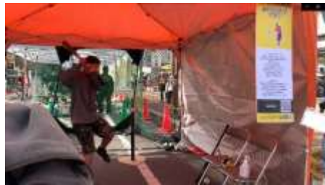
野球スイング測定