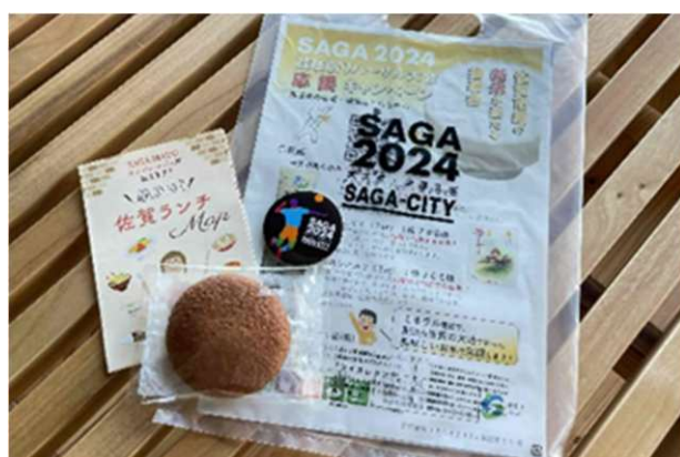
▲丸ぼうろ・缶バッジ等の配布（バレーボール）