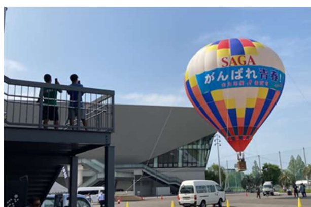
▲応援メッセージバルーン（陸上競技）