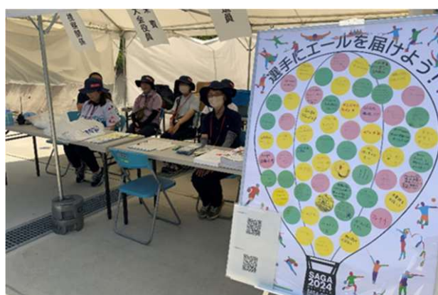
▲応援メッセージ（カヌー（スプリント））