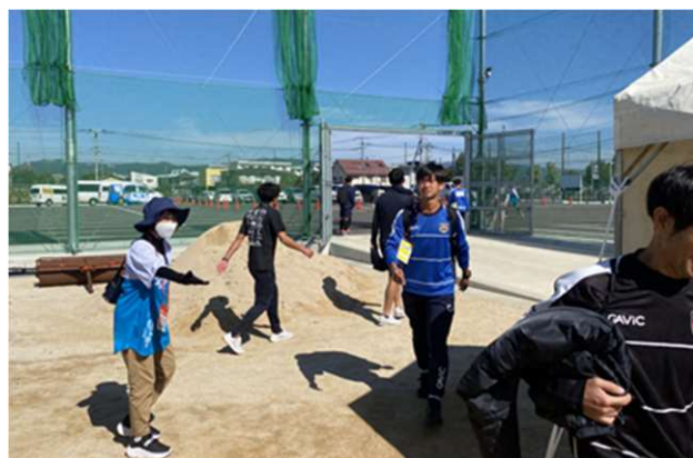
▲競技会運営ボランティア（会場案内）