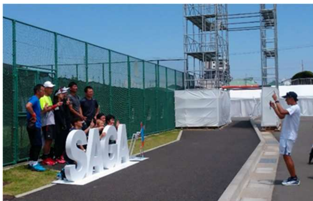
▲フォトスポット（テニス）