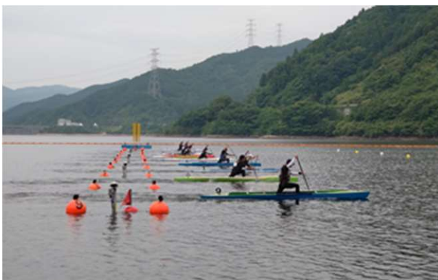
▲カヌー（スプリント）