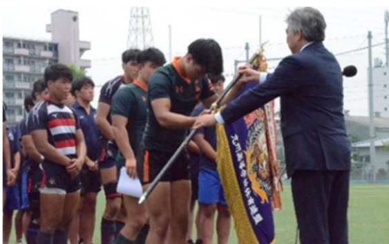
▲表彰式（ラグビーフットボール）