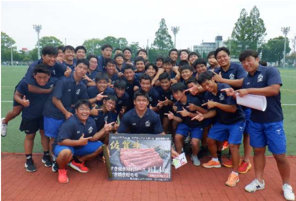
▲ラグビーフットボール