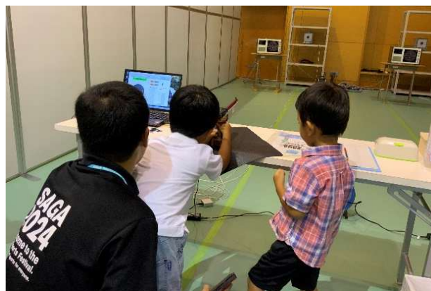
▲競技体験コーナー（ライフル射撃（25m））