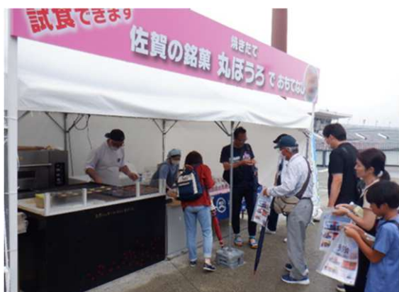
▲おもてなしコーナー（水泳（競泳・飛込））