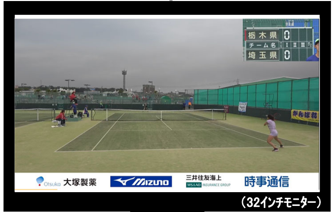
《国スポチャンネル(テニス④)配信》