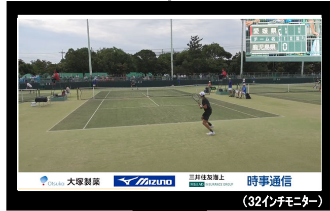
《国スポチャンネル(テニス③)配信》